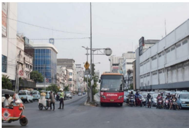
雅加达早期街道建筑充满中国风情，但随着岁月的久逝，现在已经了无踪迹。