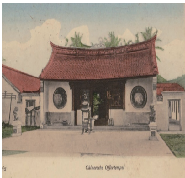
雅加达的一处数百年华人古庙的今昔对比。