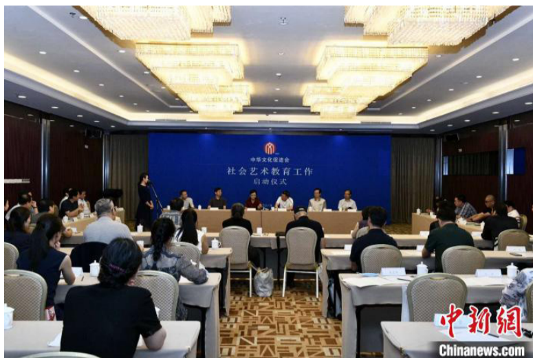
8月22日，中华文化促进会在京启动社会艺术教育中心。

2013年以来，我国关于推进在校学生艺术素质测评、加强学校美育工作、支持和鼓励民办教育等政策相继出台，包括绘画、音乐、舞蹈、书法、朗诵、文学等多个门类在内的少儿艺术培训蓬勃发展，社会艺术考级不断规范。此前，由北京大学中国教育财政科学研究所、社会科学文