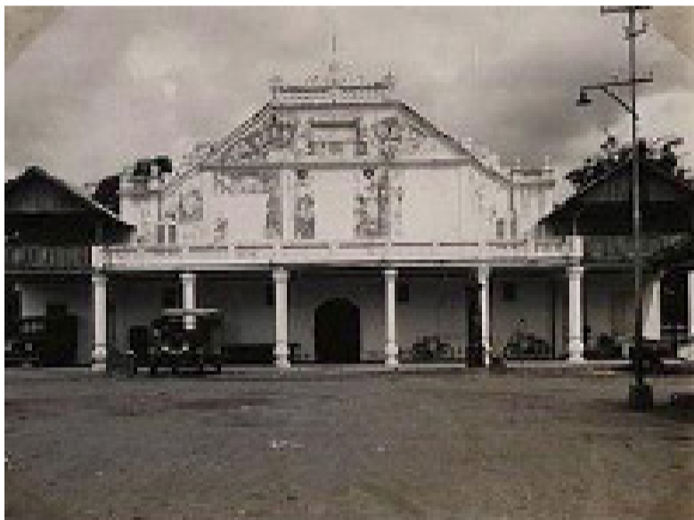
1917年的文化景点文物，毁于一旦。虽然那么多民众挽救Hebe电影院，但始终没能改变它消失的命运。