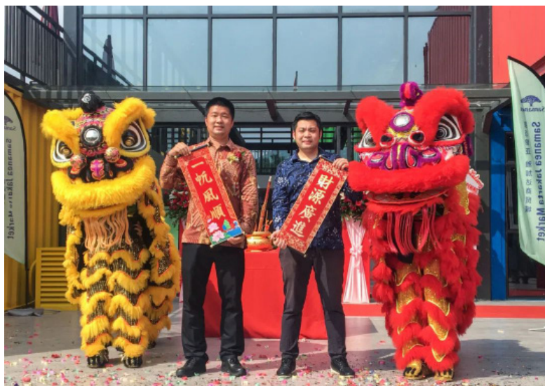
试业活动现场，金鼓齐鸣、舞狮助兴

旺盛。今年是中国和印尼建交70周年，在“一带一路”倡议的带动下，一大批中国品牌走进印尼并获得了蓬勃发展。