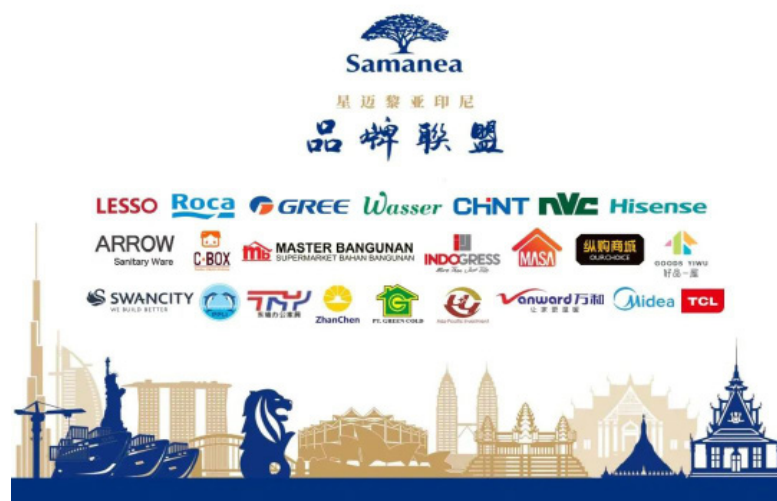
▲ 已入驻雅加达商城的部分品牌