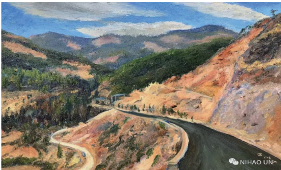
名称: 《未修完的新公路》 规格: 30x40cm 材质: 布面油画