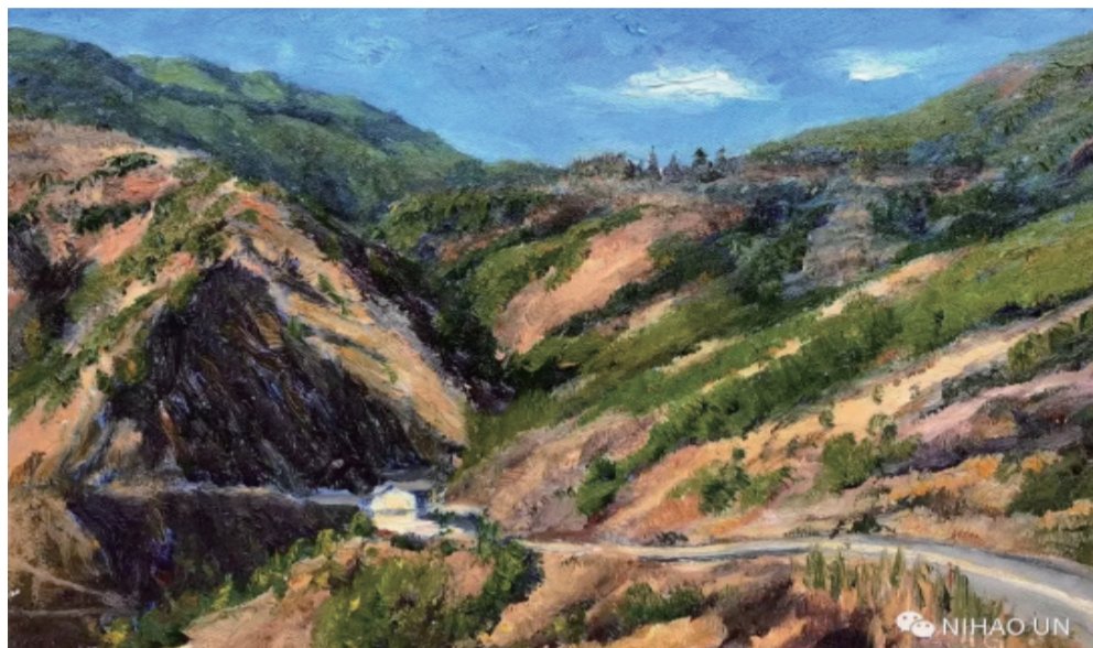
名称: 《山路弯弯》 规格: 30x40cm 材质: 布面油画