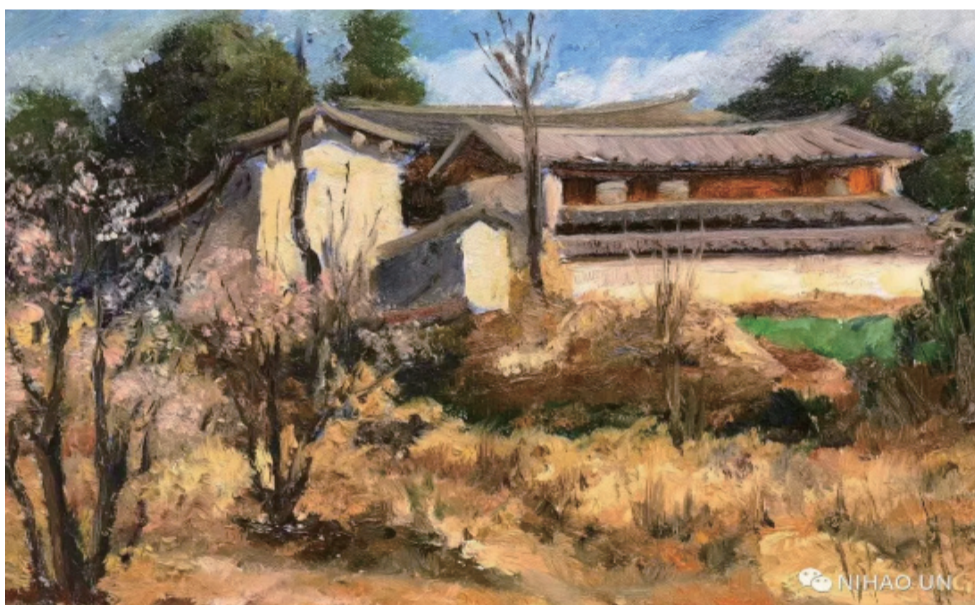
名称: 《梅园春早》 规格: 30x40cm 材质: 布面油画