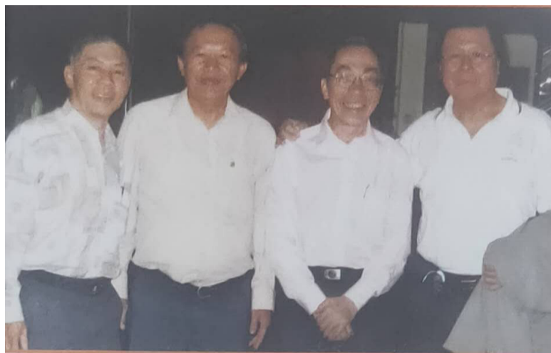
参加"東區文友學會"成立三周年