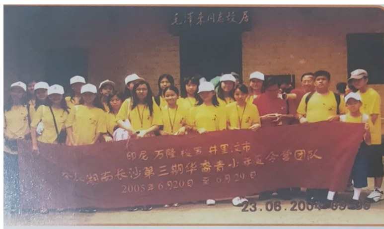
夏令营营员，摄于韶山毛主席故居