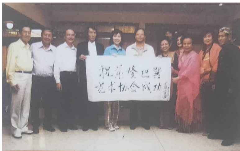
巴巽华艺术协会成员与兰立俊大使夫妇合影