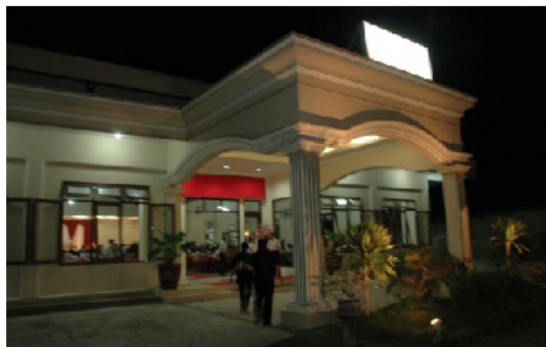
宴请地点，是一家专门做宴席的会所。