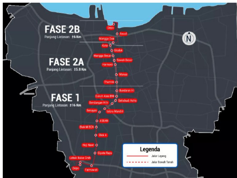
雅加达地铁线路规划图