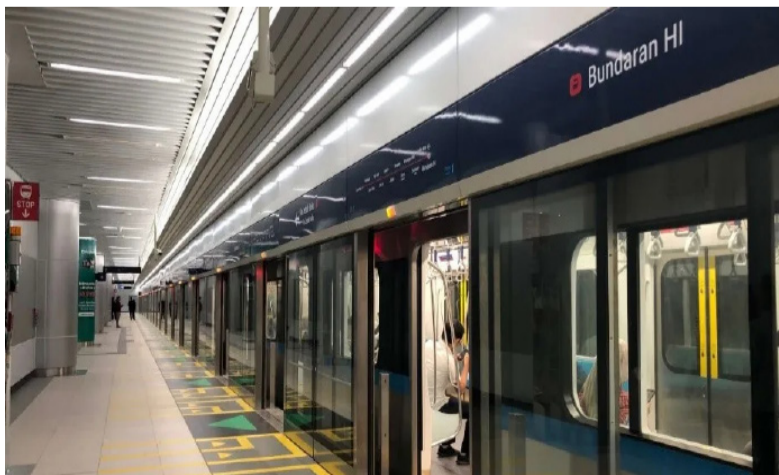
2019年3月24日，雅加达地铁一期一号线落成，正式开始运营。

二期工程B段将向北进一步延伸自Kota站到Ancol，全长5.8公里，包含三个车站。工程将于2022年开始，目标是2027年完工。