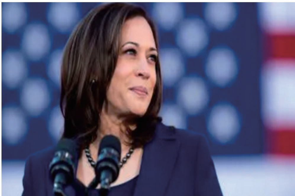
黑人女性参议员哈里斯