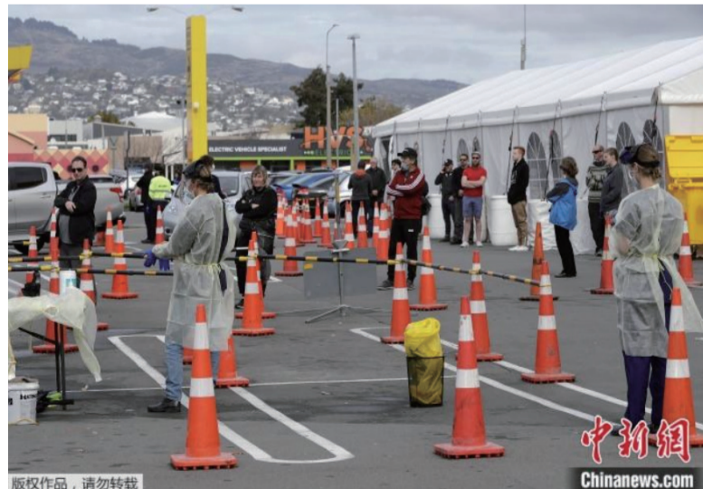
资料图：疫情下的新西兰。

注册了世界首款新冠病毒疫苗。俄卫生部表示，俄首款新冠病毒疫苗两剂次接种后，人们可形成长期免疫力，根据使用腺病毒载体疫苗的经验，免疫力最多可维持两年。俄罗斯总统普京表示，他的一个女儿已经接种了这种疫苗。