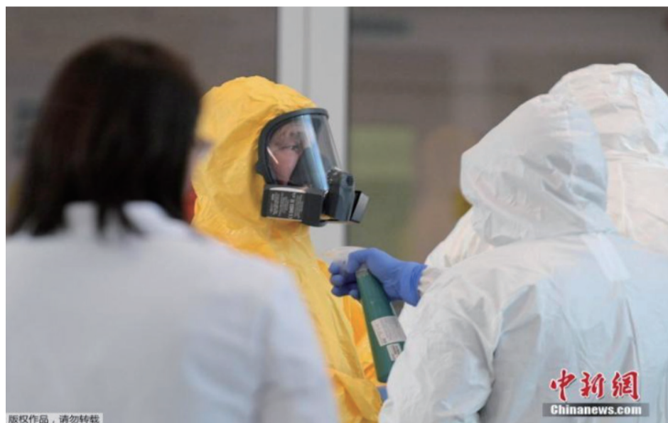
资料图：当地时间3月24日，俄罗斯总统普京身穿防护服，视察一家位于莫斯科郊外的收治新冠肺炎患者的医院。

欧仍未完全控制疫情，西欧国家总体上已遏制住大部分病毒传播，但现在也出现疫情复发，应确认聚集性疫情和社区传播，并实施本土化防控措施，避免再次经历全境封锁。