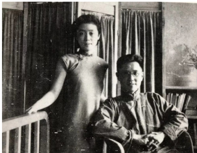
上世纪四十年代，万方的父亲曹禺和母亲邓译生（方瑞）在重庆