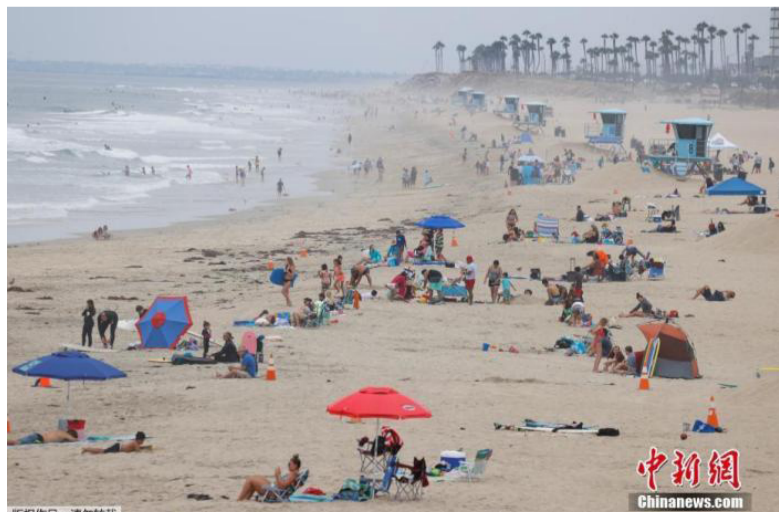
资料图：美国疫情持续蔓延，加州等地成为“重灾区”。图为加州亨廷顿海滩游客兴致不减。