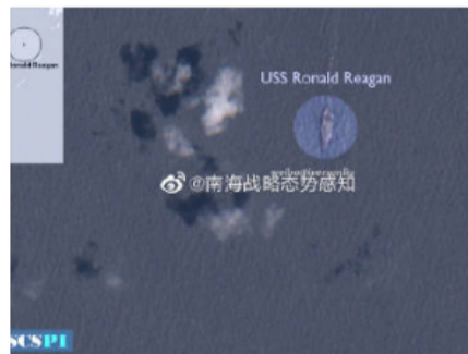
“南海战略态势感知计划”微博截图