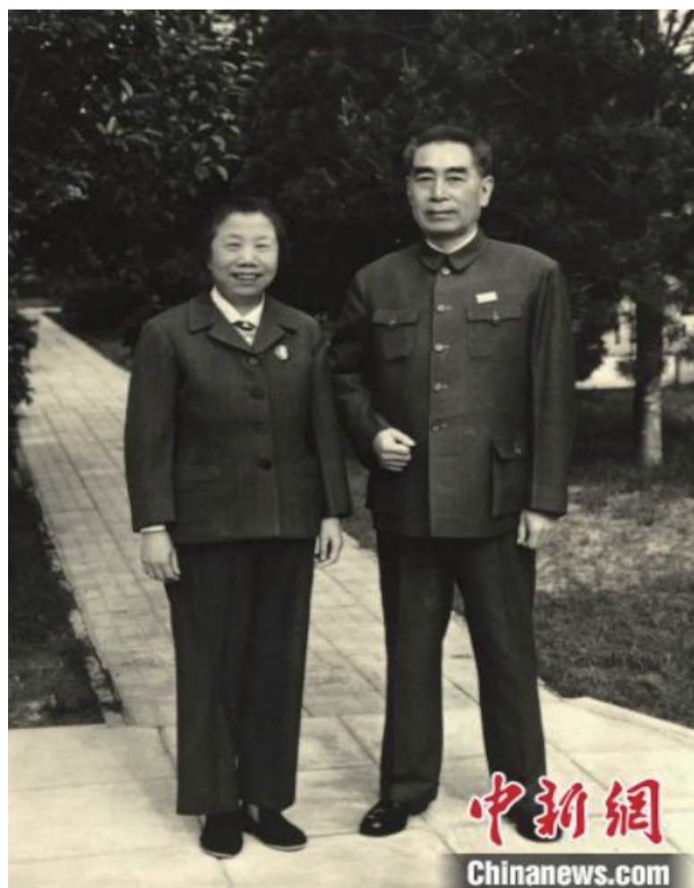
图为周恩来邓颖超最后一张正式合影。

周秉德表示，希望通过这一次《海棠绽放纸短情长》线上展，让广大网友特别是当今的年轻人能够了解到书信和照片背后的故事，体会到周恩来和邓颖超这两位中国共产党的优秀楷模，用实际行动诠释出的理想信念与爱情观、婚姻观和家庭观。（完）