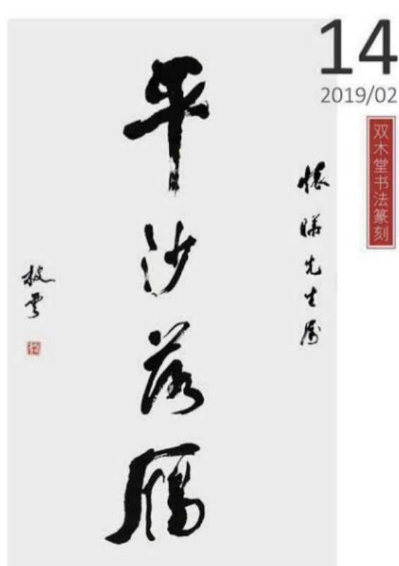
中文名: 梁披云 职业: 著名诗人、国学大师、书法家、教育家、社会活动家 成就: 创办黎明大学