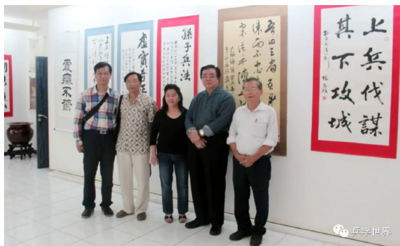
印尼举办《孙子兵法》书法展