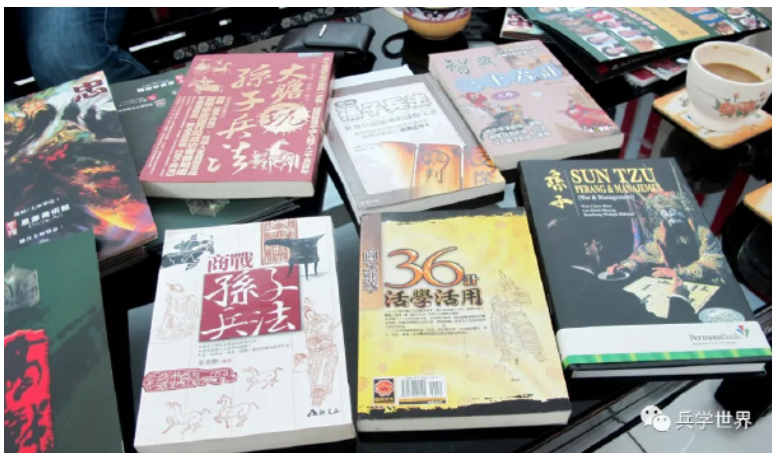
各种版本印尼文《孙子兵法》

中国的兵家文化，也成为印尼文化中不可或缺的一部分。印尼历史上第一位由民主选举产生的