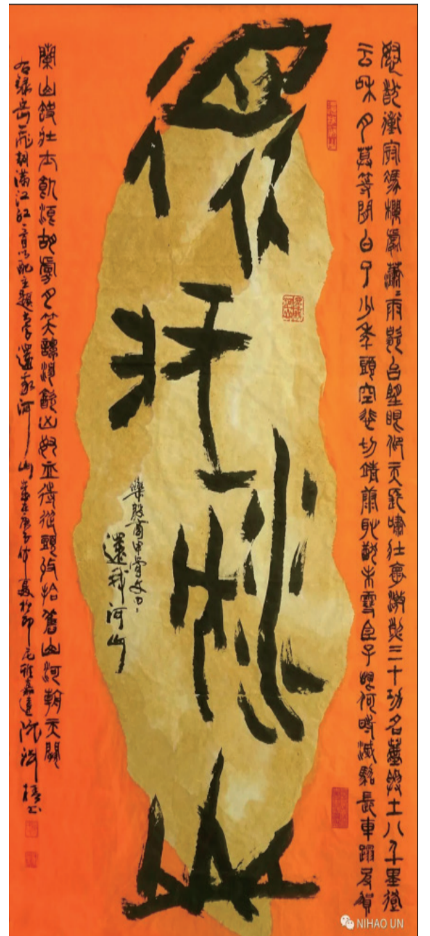
名称：《还我河山》 材质：宣纸