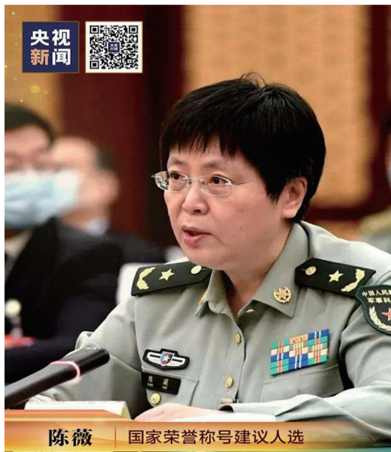
陈薇 | 国家荣誉称号建议人选

他为确认新冠病毒赢得了时间，为开展新冠肺炎病理研究创造了条件。作为渐冻症患者，他冲锋在前，身先士卒，带领金银潭医院干部职工共救治2800余名新冠肺炎患者，为打赢湖北保卫战、武汉保卫战作出重大贡献。