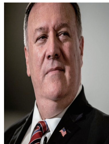
美国国务卿 迈克·蓬佩奥