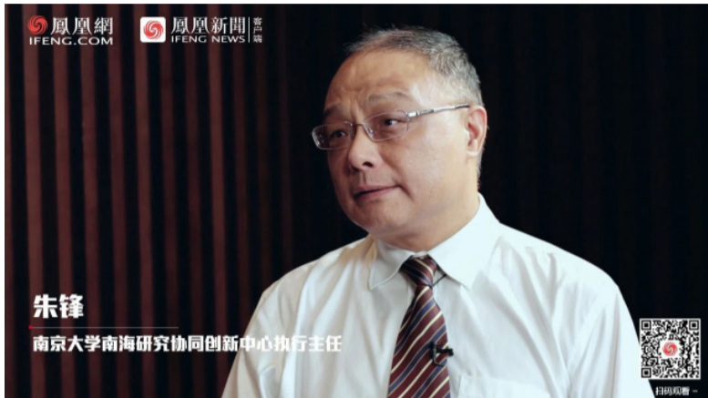
本期嘉宾：南京大学南海研究协同创新中心执行主任、国际关系研究院院长朱锋教授。