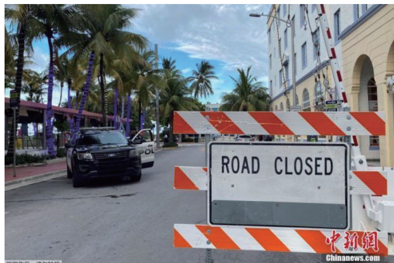
当地时间7月18日，由于新冠肺炎疫情反弹，美国佛罗里达州迈阿密海滩从晚上8时起实行宵禁，道路封闭，饭店停止营业。

戴维斯指出，目前而言，如果病毒在美国全国的传播不能很快得到控制，经济“二次探底”的出现仍具有高度可能性。