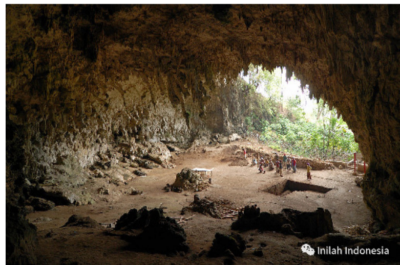
发现“穴居矮人”的Liang Bua洞