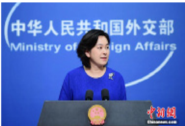
外交部发言人华春莹

华春莹指出，今年以来，新冠肺炎疫情对各国人民生命健康和经济社会发展造成严重冲击。地区国家在东亚区域合作机制框架下率先开展抗疫合作，成功举行东