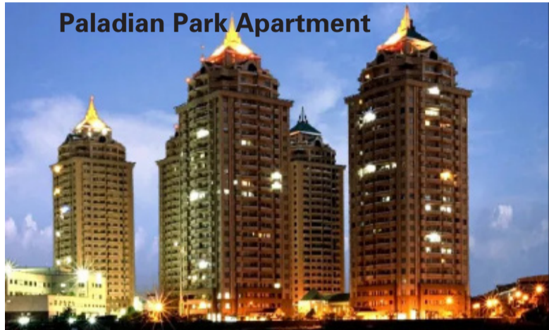
Paladian Park Apartment