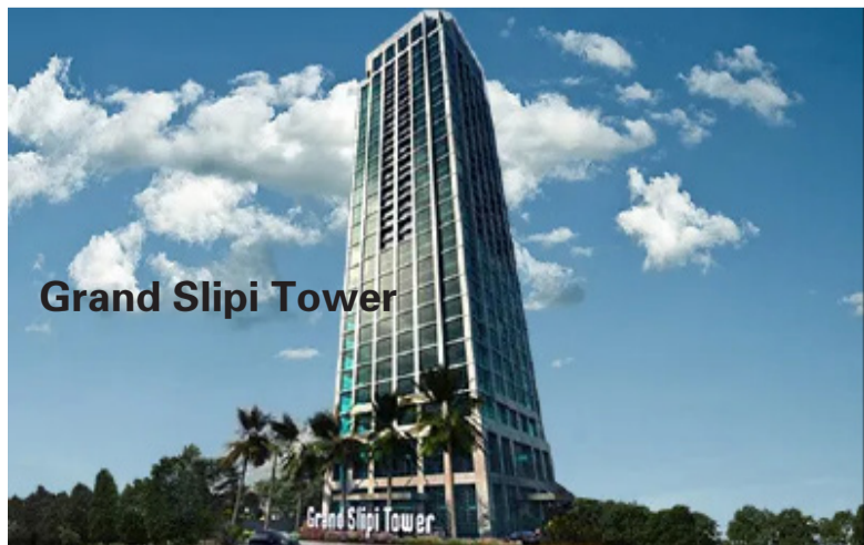
Grand Slipi Tower