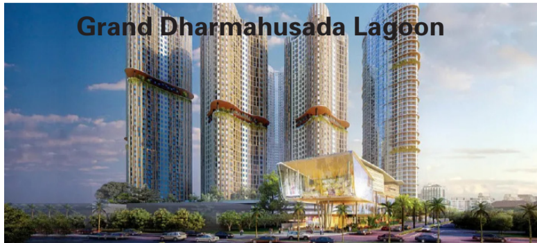
Grand Dharmahusada Lagoon

段，是一座以未来主义及自然元素平衡为理念设计的超级公寓大厦。其生活商城和商业区及公共空间设