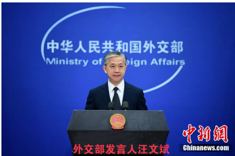
外交部发言人汪文斌

汪文斌是一位沉稳干练、履历丰富的资深外交官。他具有多个领域的外交工作经验，曾长期从事外交政策规划工作，担任过驻突尼斯大使。人们相信，汪文斌副