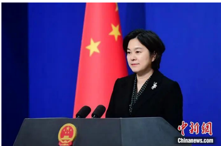
外交部发言人华春莹