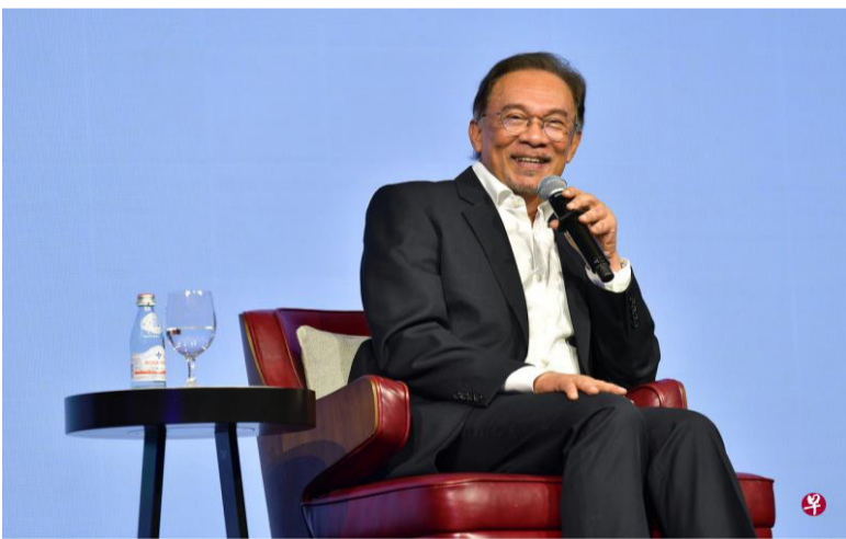
马国下院议长莫哈末阿里夫宣布，希盟同意公正党议员安华出任国会反对党领袖。(档案照)

道，马国周一(13日)上午召开第14届第三期第二次会议，国会下议院议长莫哈末阿里夫宣布，希望联盟同意公正党波德申国会议员安华出任国会反对党领袖。