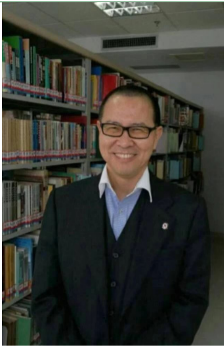
1928-1941 10. Conclusion 该著作荣获提名