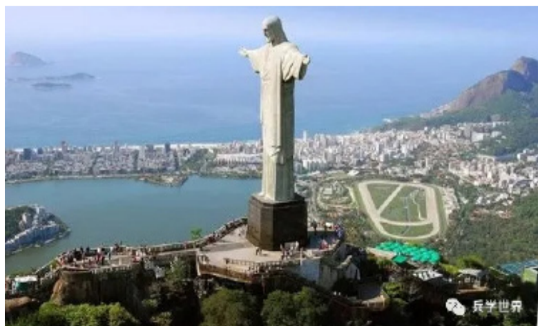
巴西里约热内卢的耶稣山