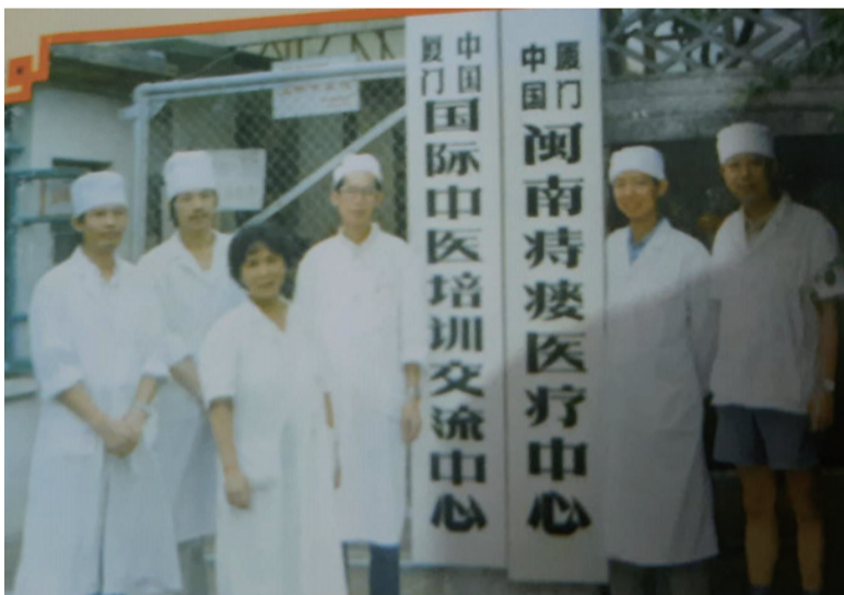
在厦大实习肛肠中心与老师合影