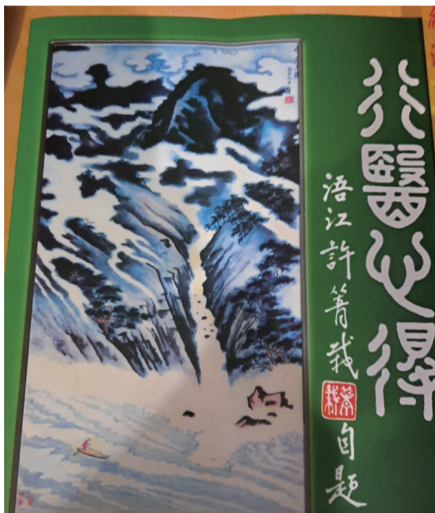
许箐栽著作<行医心得>