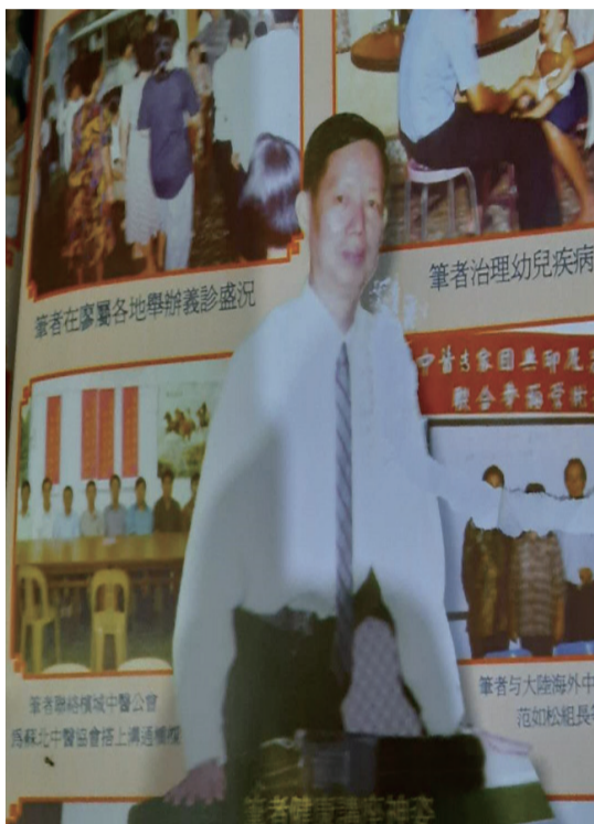
许医师近照与义诊图