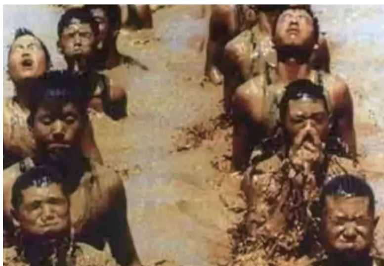
那一年，流行的一句话就是“人在堤在”，无数的解放军官兵用自己的身体筑成堤坝。