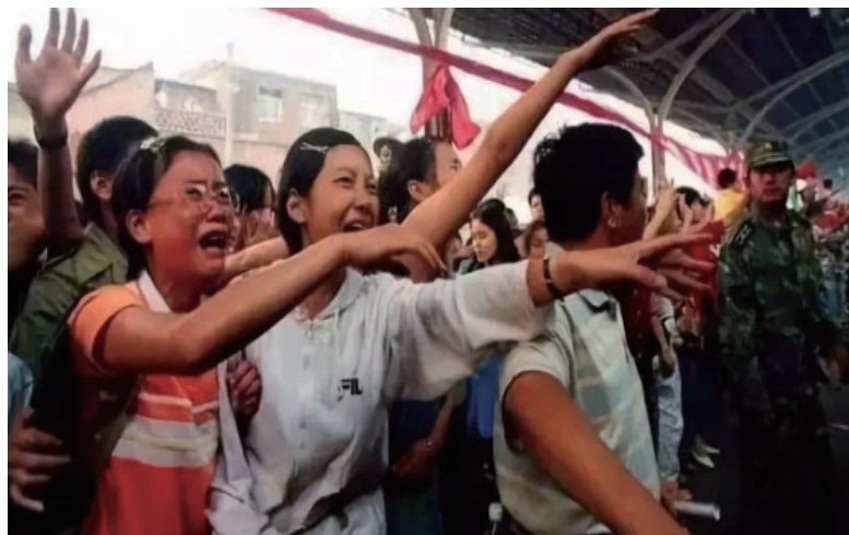
那一年，汉口火车站无数市民洒泪送别“救命恩人”。

计——截止6月26日，全国共有26个省区市遭受洪涝灾害，1374万人受灾，死亡失踪81人。