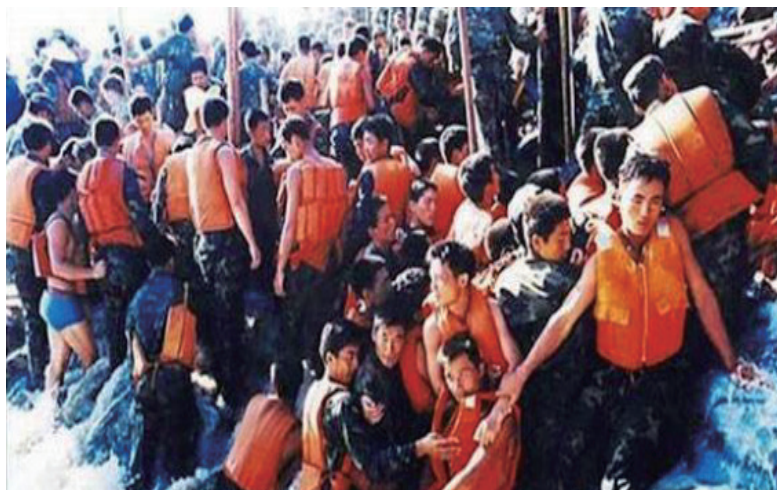
那一年（1998年），整个暑假播放的都是抗洪救灾的新闻。