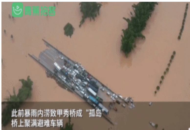
此前暴雨内涝致甲秀桥成“孤岛” 桥上聚满避难车辆