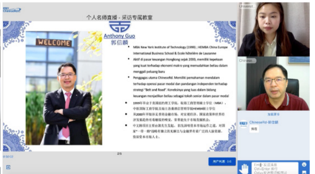
ChineseRd (中文路) 创始人郭信麟先生专访