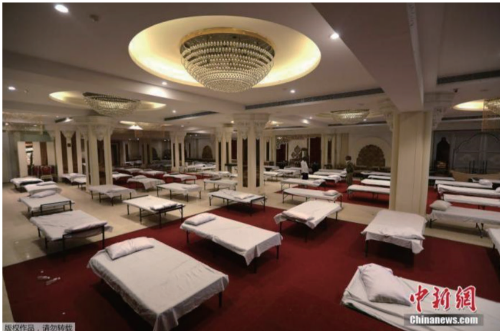
当地时间6月15日，印度新德里，宴会厅被改造为临时医院。

中新网6月29日电 综合报道，美国约翰斯·霍普金斯大学实时统计数据显示，截至北京时间6月29日8时33分许，全球新冠确诊病例已超1011万，累计死亡超50万。路透社数据显示，每18秒就有1人死于与新冠病毒相关的疾病。