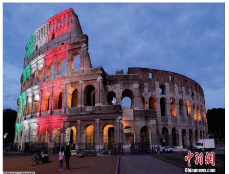
6月1日，意大利首都罗马，罗马斗兽场重新开放。出于防疫原因，参观者在入场时被要求戴上口罩、测量体温并进行手部消毒。