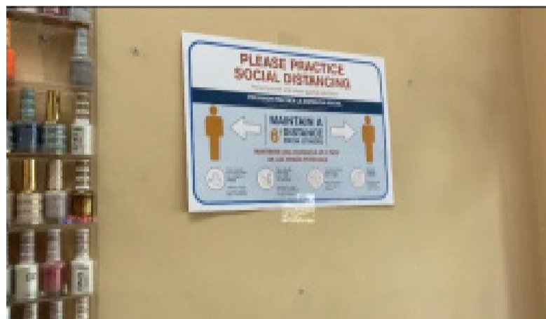
美甲店配合卫生局防疫措施恢复营业