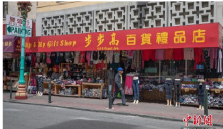
当地时间5月18日，一名戴口罩男子路过美国旧金山华埠一家店铺

顾客在户外用餐。当日，纽约市按预定计划进入第二阶段重启，市政府预计将有约30万人重返工作岗位。