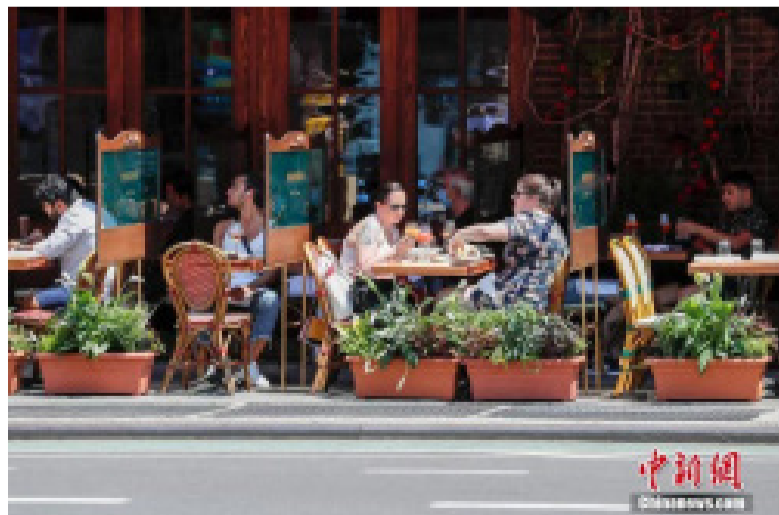
当地时间6月22日，纽约曼哈顿一家餐厅，顾客在户外用餐。当日，纽约市按预定计划进入第二阶段重启，市政府预计将有约30万人重返工作岗位