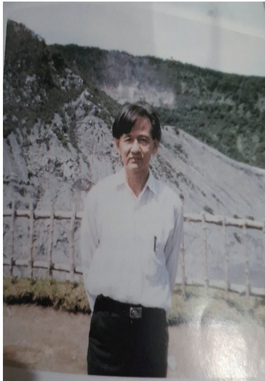
叶青十多年前照片