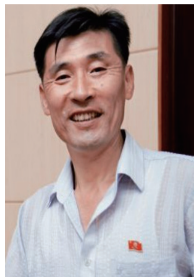
鱼部长每天出门前整理着装的时候，第一件事是确认自己戴上了领袖的像章