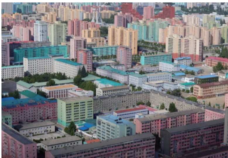
平壤市区五彩缤纷的楼房