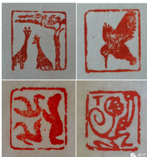
苟皓东图章作品观略