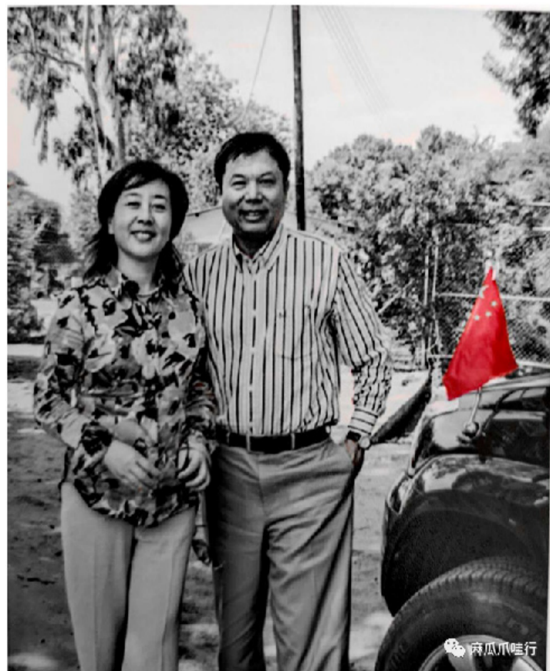
皓先生伉俪。看吧，应该是顽童皓先生给黑白照片染了红色

外交大事仿佛遥远；人间烟火、刷圈玄谈、文赋书画，他玩的起劲。只觉得他更像一位艺术家。大