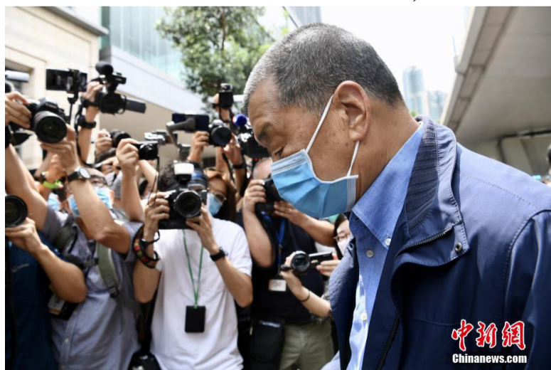
图为黎智英抵达法院。