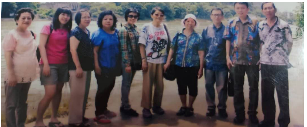
暨南大学毕业典礼后，与同学们到广西桂林旅游合影。