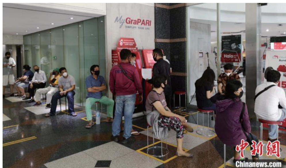
图为市中心一移动通信营业厅前排队的顾客。