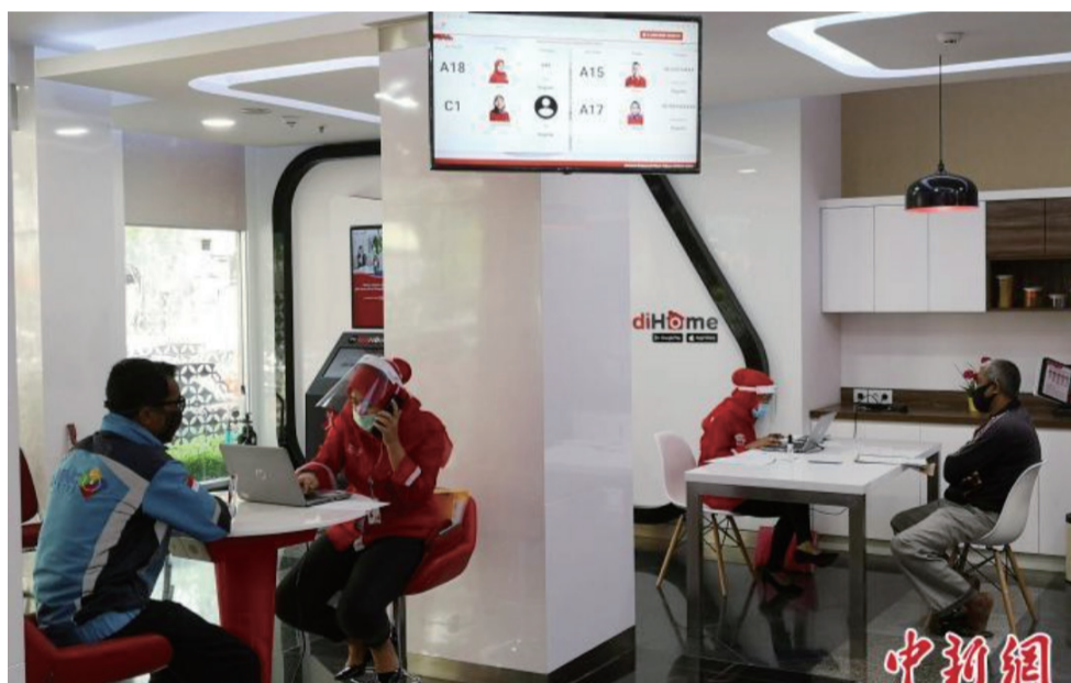
图为市中心一电信营业厅里，员工“全副武装”办理业务。