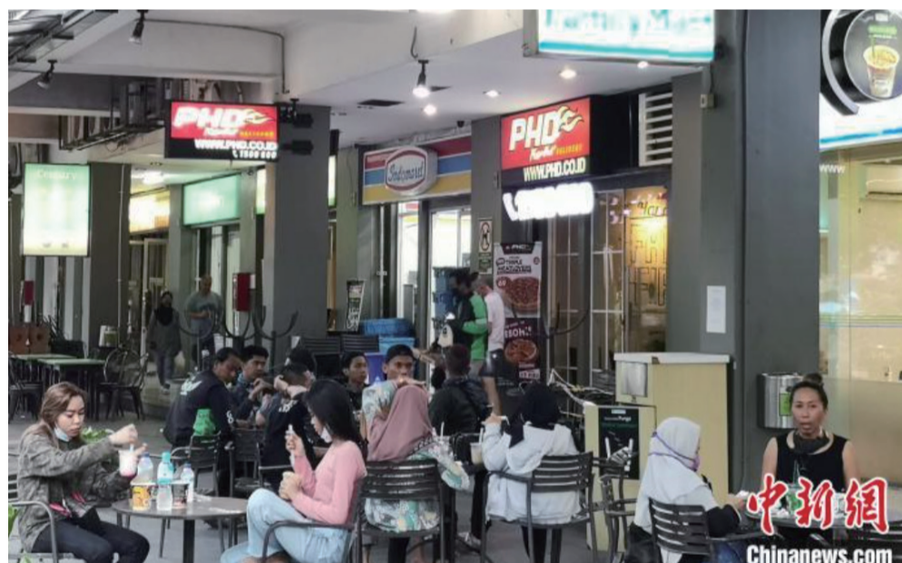
图为许多小区的餐馆恢复了堂食服务。林永传 摄 (中国新闻网)

中新网雅加达6月8日电(记者林永传)8日是印尼首都雅加达进入防控新冠肺炎疫情“新常态”前“过渡期”的第一天。虽然仍处于“大规模社会限制”实施阶段，但雅加达街头已车流滚滚，民众在商