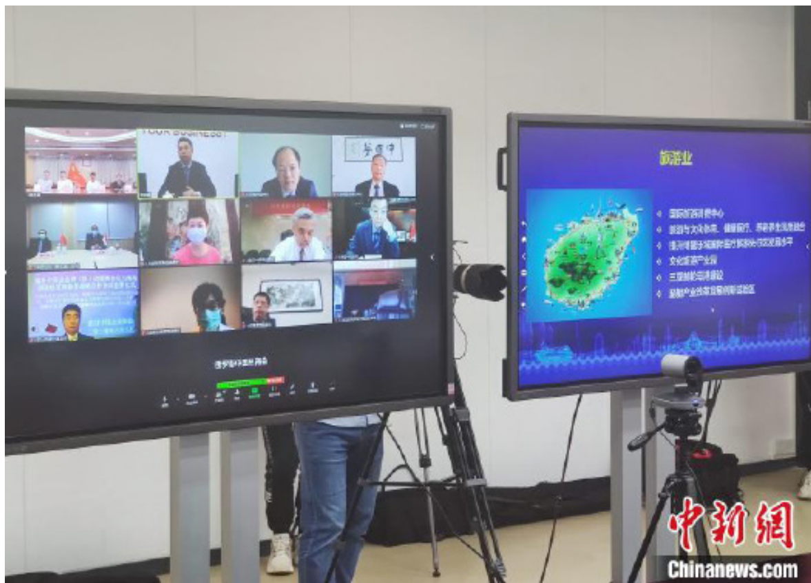
海南国际经济发展局与多国中资企业商(协)会进行视频签约仪式。

3日下午,首批境外中资企业商(协)会联席会议成员与海南国际经济发展局战略合作签约仪式暨海南自贸港重点产业投资机遇推介会通过“云视频”方式举办。商务部副部长钱克明、海南省副省长沈丹阳出席活动并致辞。新加坡、日