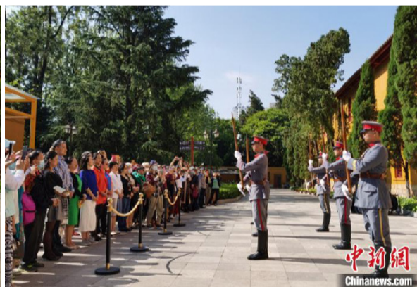
图为换岗仪式。

将充分发挥好“中国华侨国际文化交流基地”的品牌优势和作用,在进一步做好馆藏收集和整理研究工作的基础上,深度挖掘讲武堂的历史文化内涵,创造性地开展富有“侨”的特点和昆明地域特色的文化活动,讲好昆明故事;以“侨与中国梦”为主题,以契合海内外侨胞文化需求为切入点,为归