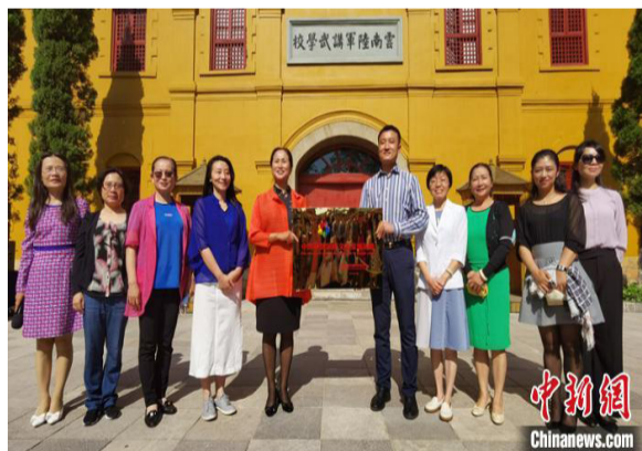
图为授牌仪式现场。

“中国华侨国际文化交流基地”是中国侨联整合社会资源、推进优势互补、弘扬中华优秀传统文化、合力开展海内外文化交流活动的重要平台。2019年12月,经中国侨联审定,云南陆军讲武堂历史博物馆被确认为第七批“中国华侨国际文化交流基地”,成为昆明市首个国家级华侨文化交流基地。