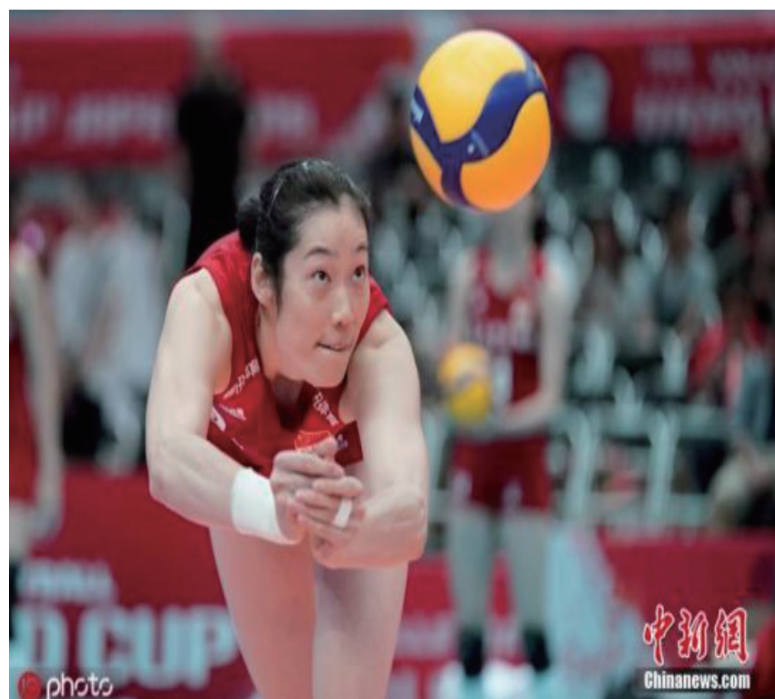
资料图：朱婷在比赛中。

如今受疫情影响，东京奥运会延期至2021年举行。朱婷曾坦言，东京奥运的延期一度让自己产生心理波动。但面对困难，要耐得住寂寞，应对变化、补强短板、抓住机遇。（完）