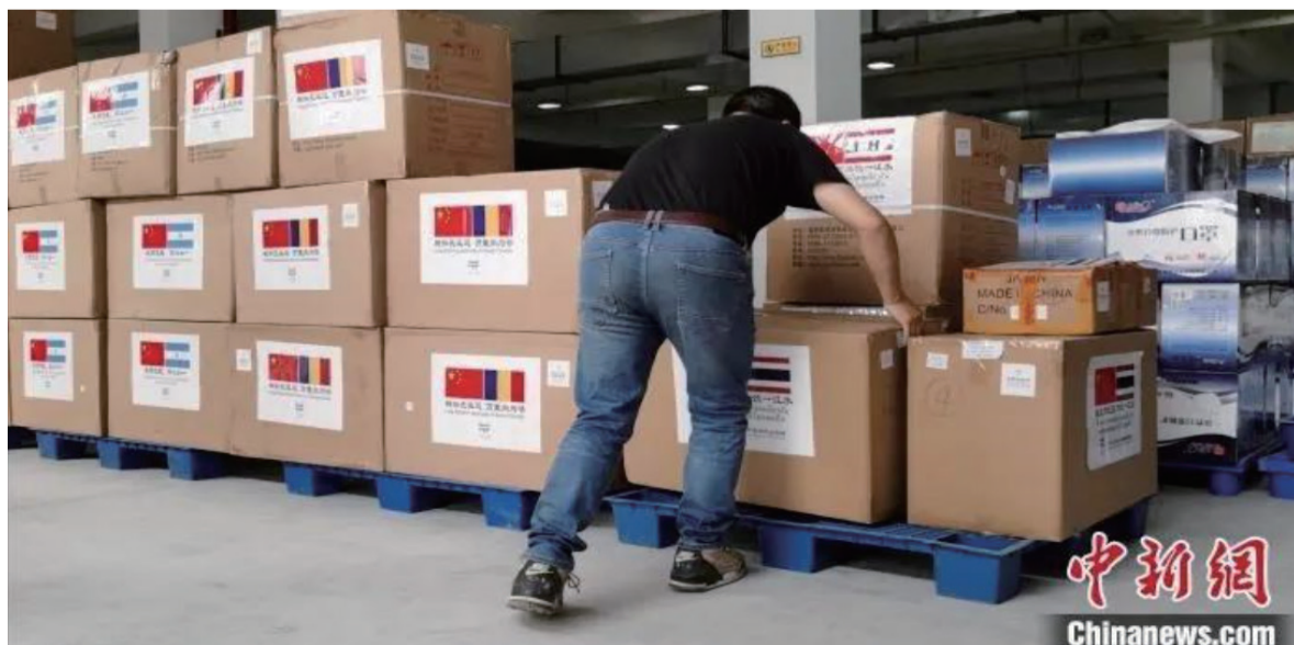
资料图：第二批福建省向国际友城捐赠防疫物资18日启运。