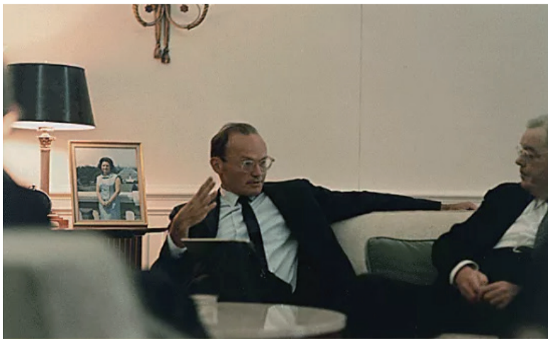
图：美国国家安全局官员麦克乔治-本迪（McGeorge Bundy）。

致电比尔-本迪，提议向亚当-马力克缴交一大笔钱。“我方决定拨款5000万盾（当时约1万美元），充作亚当-马力克行动的费用。当时由美国军方组织由平民出面的行动组合，仍然面对很大的压力。”