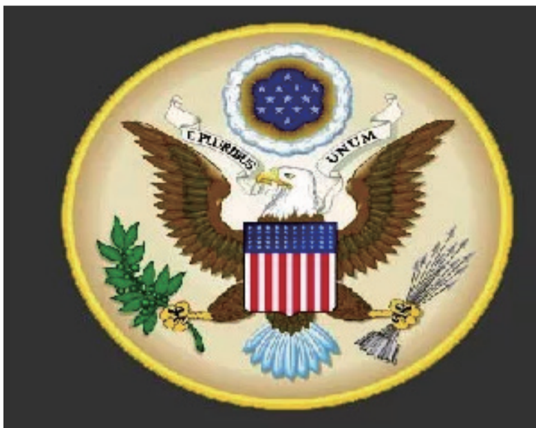
图：美国大使馆的标志，干预外国内政的大本营。