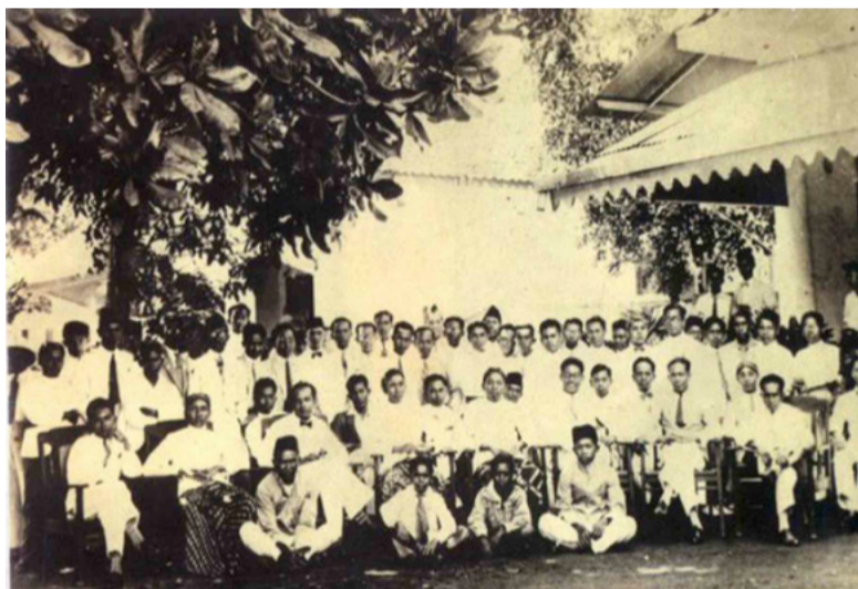
早期的印尼精英社会的集会合影，显然经常见到华裔的面孔。