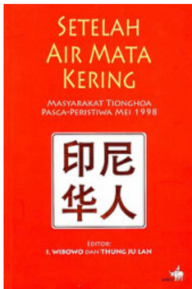
描述1998年排华暴力惨状的《眼泪流尽的印尼华人》。

关于此事并没有苏加诺总统的条例。苏哈托将军上台后，1966年在印度尼西亚才在没有书面规定的情况下强迫改名换姓。希望上述更正对理解乌斯塔兹·亚西尔所描述的各种问题能有所启发。