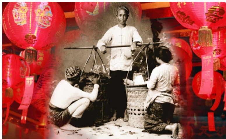
印尼本土历史博客，也可见到早期移居印尼的中国人穿巷走街肩挑售卖的图片。