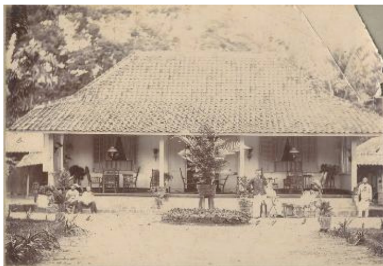
邦加岛的华人二战前或更早的房屋，已经有浓郁的热带风格。