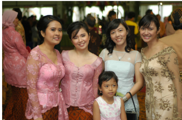
印尼华裔在印尼繁衍，多达7-8代，少至3代，其后代也早于融入社会，如华裔女子穿着印尼传统的Kebaya服装，但至今为止，华裔却仍然不为主流社会接纳，歧视及仇恨乃家常便饭。

独立后参与政治活动的印度尼西亚中华党领导人继续坚定地号召华人社区支持印度尼西亚共和国，并接受印度尼西亚为