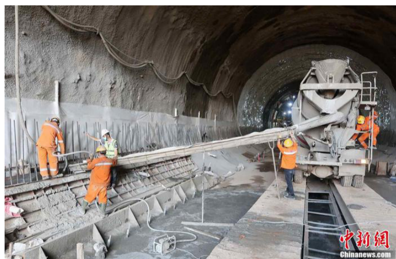
图为中国中铁印尼雅万高铁项目经理部管段的隧道施工。